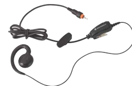
Auricular con botón de pulsar para hablar (PTT) integrado

Este diseño revolucionario de líneas perfectas ofrece una carga rápida para su CLP de Motorola. Un cargador de unidades múltiples le permite cargar cómodamente hasta seis CLP de Motorola al mismo tiempo. El cargador está diseñado con un bolsillo trasero para guardar su auricular mientras se carga la unidad, y se puede montar sobre la pared si no hay mucho espacio.